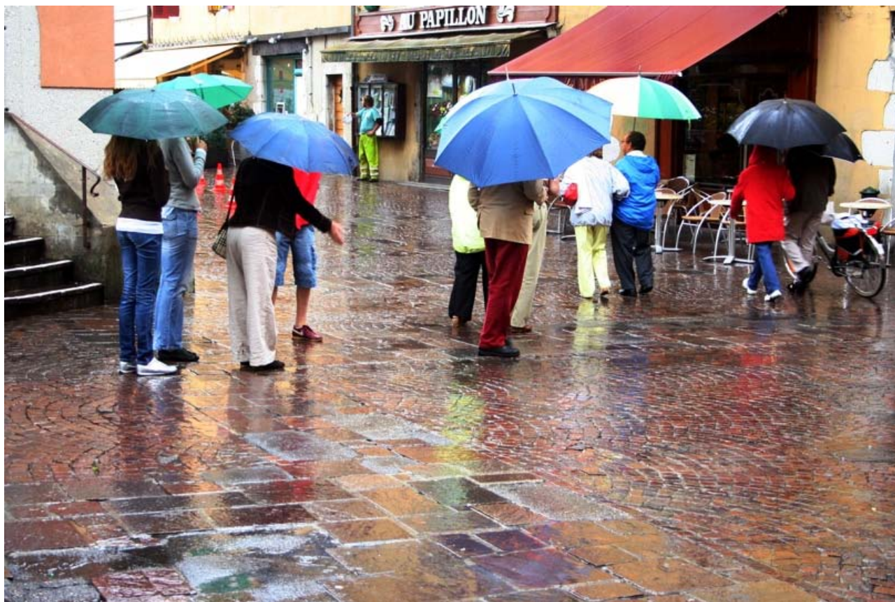
Stedernes særlige patina skal man have øje for. Gadebillede Annecy, Frankrig.

Men at føle sig hjemme, at høre til, at genkende og læse traditionen, er centrale elementer i denne tænkning: "Whether you live in a town, a city or in the country, there are some things around you which are part of your daily round. Perhaps there are buildings which seem 'at home' in the landscape because they reflect the lives of the people who lived in the area before you - a mill, a line of houses, a quay or railway station; perhaps you enjoy a walk along lanes lined with primroses in spring, through water meadows or wild fells grazed by sheep; your walk may take you between the ducks on the canal and red brick warehouses, or through the sounds and smells of the street market to school. Wherever you are, it is the detail and overlays which have meaning to you and which give your area its own local distinctiveness." Folks følelse af tilhørsforhold og "sense of place", deres værdisætning af stedernes specifikke elementer, skaber i flg Common Ground bevægelsen altså forudsætningerne for det gode liv.