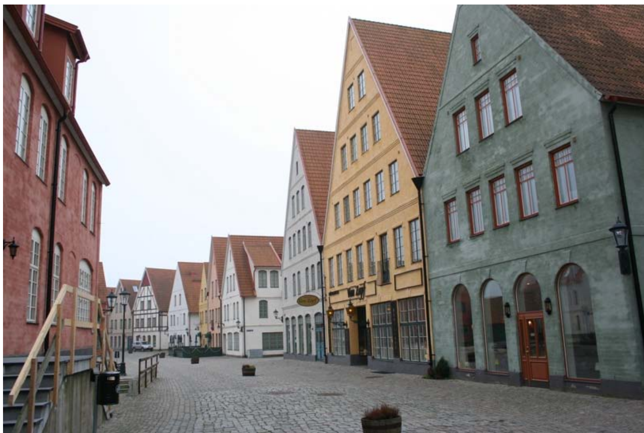
Gadeparti fra Jakriborg, Skåne.

Som et menneske med mange ønsker og behov? Som "bærer" af en livsform? Som levende en livsstil?