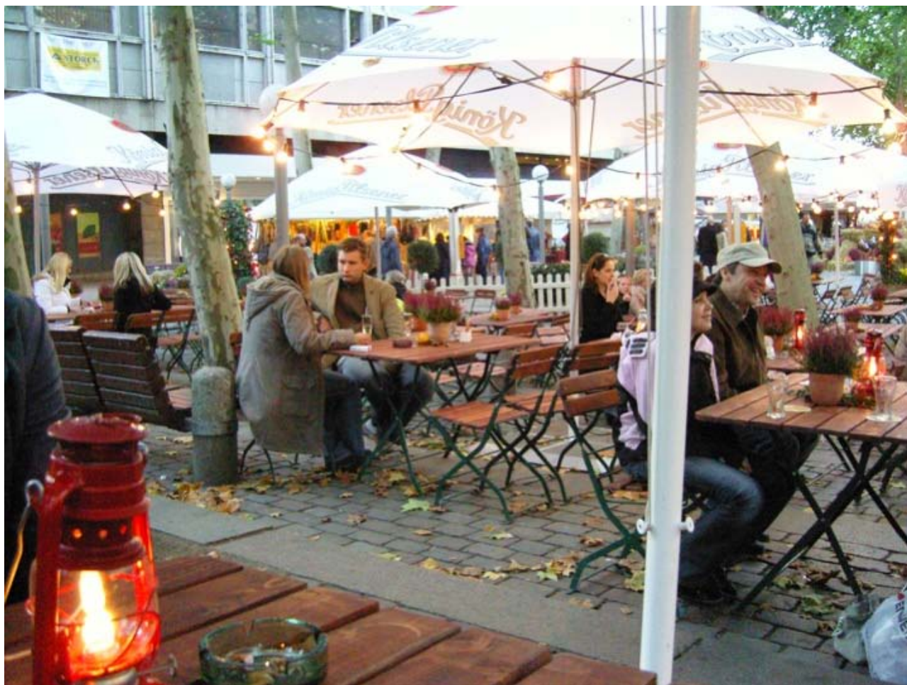
Lokalt mødested, Berlin.